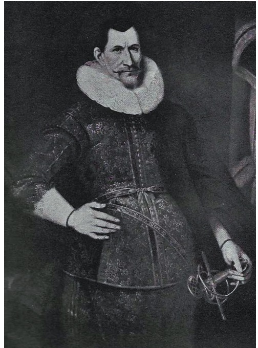
Jan Pieterszoon Coen, Gouverneur-Generaal 1619-1623 en 1627-1629. Schilder onbekend.

Hij overtuigde het hoogste V.O.C.-gezag (Heeren Zeventien) dat met name door de kolonie, veel geld opgebracht kon worden. Migrantenzouden generaties van mannen voor het V.O.C.-leger en administratieve functies leveren. Hij pleitte voor het sturen van boeren, ambachtslieden en leraren.