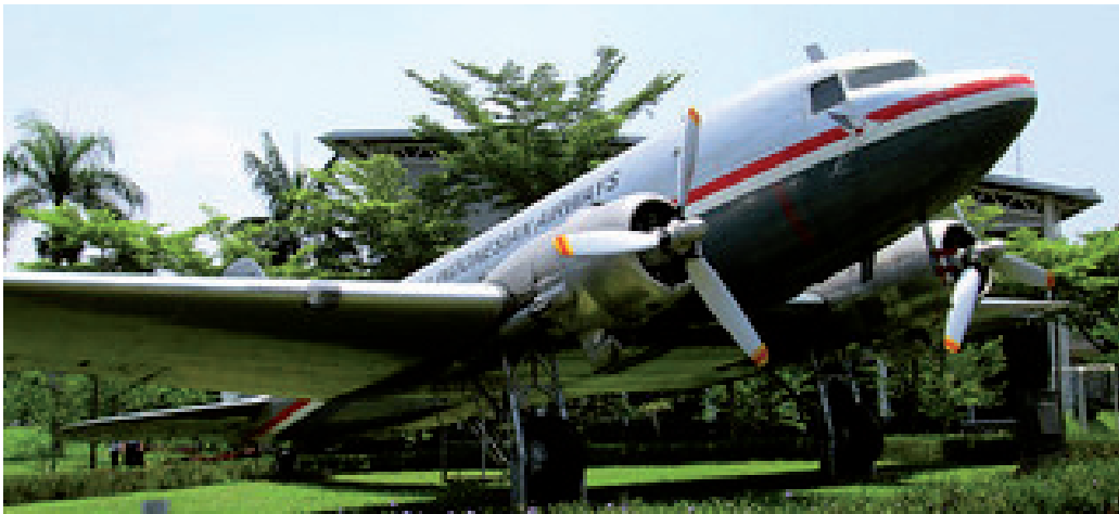
Dakota (DC3) van Garuda. Het eerste toestel, nu tentoongesteld.

Na de opheffing van het K.N.I.L. in juli 1950, repatriëerden veel K.N.I.L.-militairen met hun gezinnen naar Nederland.