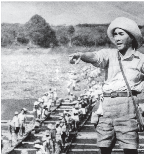
Soekarno als romusha in romusha-uniform. Duizenden Indonesiërs overleefden het gedwongen werk voor de Japanners niet.

Op de andere eilanden werden Europeanen wel direct geïnterneerd. Met het wegvallen van de oude economie, waren bijna alle mensen hun inkomen, have en goed kwijt. Vaders worden in concentratiekampen geplaatst, moeders en kinderen die achterblijven worden eveneens in interneringskampen geplaatst. Dit alles onder de meest barre en mensonwaardige omstandigheden!