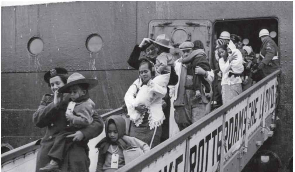
Aankomst in Nederland, start van een vaak moeizame assimilatie.

Vandaar dat men soms met de te treffen maatregelen achter de feiten aanliep en er vervolgens dan maar geïmproviseerd moest worden.