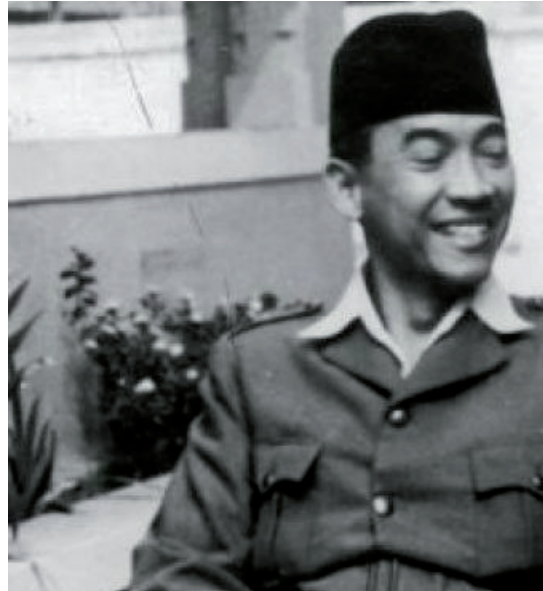
Soekarno gevangengenomen door het Nederlandse leger, december 1948.

Binnen enkele uren was de stad in Nederlandse handen en waren de Indonesische leiders Soekarno en Hatta opgepakt. De Republikeinse legerleiding waaronder opperbevelhebber Soedirman, slaagde er evenwel om te ontsnappen. Uiteindelijk werden wel alle territoriale doelen in Midden-Java bereikt, maar men was er niet in geslaagd, om het Indonesisch leger de genedslag toe te brengen.