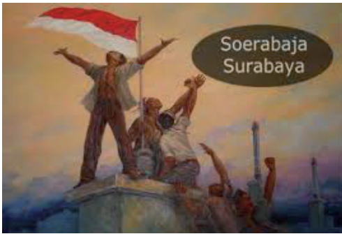
Driekleur wordt tweekleur in Soerabaja.

Het kwam tot massale gewelddadigheden, waarbij onder de Indische Nederlanders, de volbloed Nederlanders, Ambonezen, de van pro-Nederlandse gezindheid verdachte Indonesiërs en Chinezen, ongeveer 35.000 doden vielen onder wie ook vrouwen en kinderen. Huizen werden geplunderd, inwoners werden vermoord, gemolesteerd of de bossen ingejaagd, waar zij het slachtoffer werden van andere bendes.