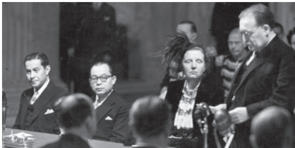
Ondertekening erkenning Indonesische onafhankelijkheid, 27 december 1949.

Op het internationale vlak werd de druk op Nederland verder opgevoerd.