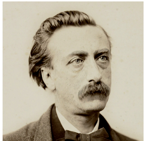
Eduard Douwes Dekker / Multatuli, 1820-1887.

Hoewel Nederland genoeg winst kon halen uit de oogst, ging het toch deelnemen aan het modern imperialisme. De drijfveer hiertoe was voornamelijk de persoonlijke eerezucht van de koloniale officieren en bestuurders.