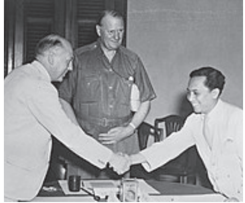
Overeenkomst van Linggadjati, 25 november 1946. Van links naar rechts Schermmerhorn, Killearn en Sjahrir.

karakter had; namelijk de contrakrachten in de Republiek uit te schakelen, die een diplomatieke oplossing van het conflict saboteerden.