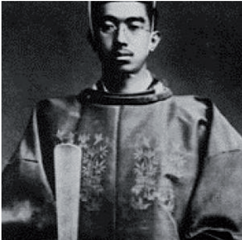
Keizer Hirohito op jonge leeftijd.

Na de capitulatie van Japan wilden de geallieerden (International Tribunal for The Far East) dat de Japanse oorlogsmisdadigers zich voor de Rechtbank zouden verantwoorden, hetgeen aldus geschiedde tijdens het Proces van Tokio (3 mei 1946 tot 12 november 1948). Met uitzondering van Keizer Hirohito moesten diverse Japanse legerleiders wel voor dit tribunaal verschijnen en werden zij veroordeeld tot lange gevangenisstraffen en zelfs tot de doodstraf.